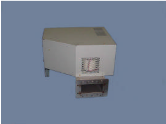
マイクロ波発振部